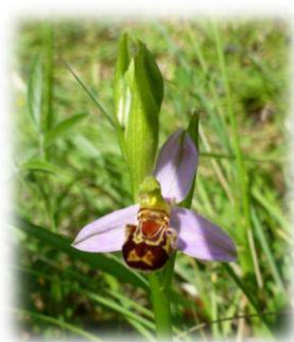
Balade Orchidées et Médicinales