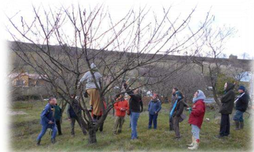
Stage de taille douce des fruitiers