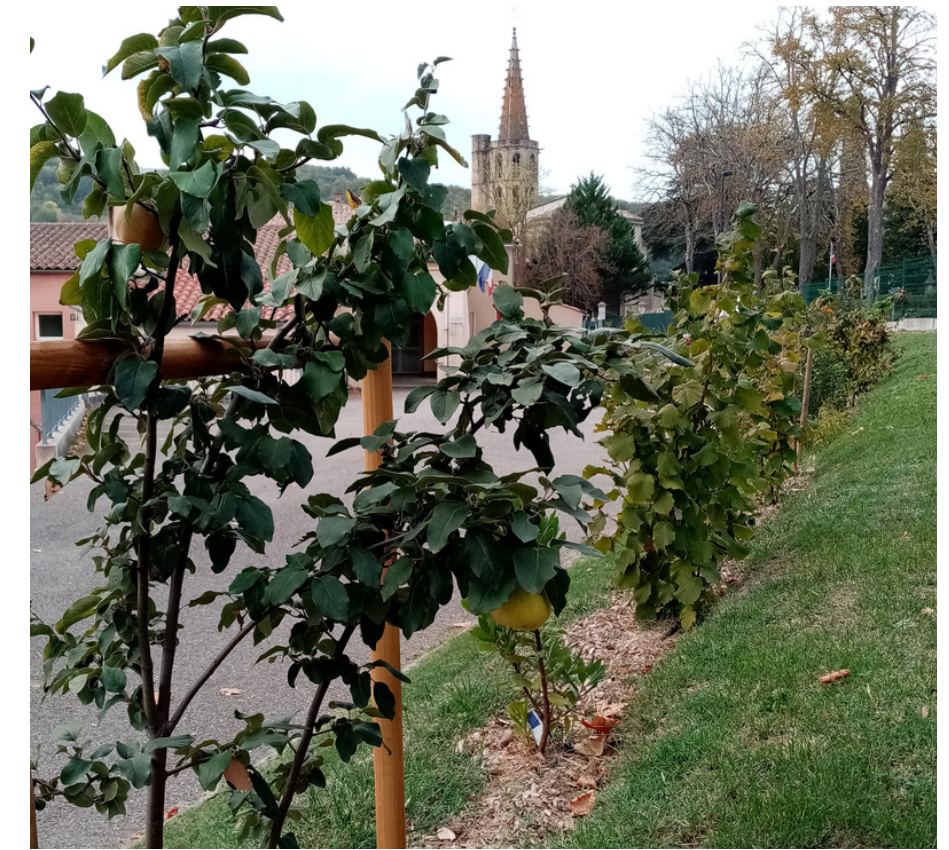
Collège de CHALABRE (11230) Haie fruitière - 80m - 2020