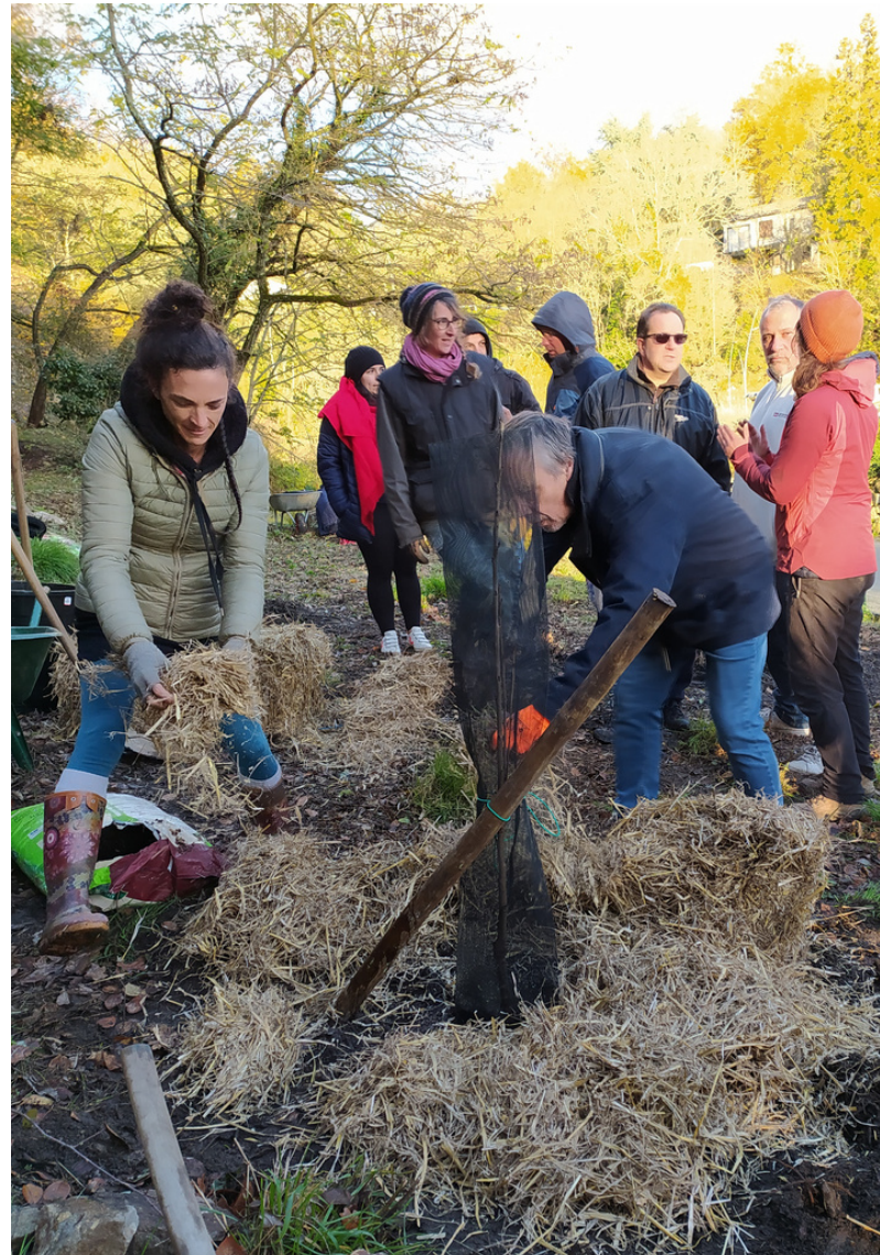
SAISSAC (11310) Verger des Jardins partagés de l'Aiguebelle 8 fruitiers - 2021