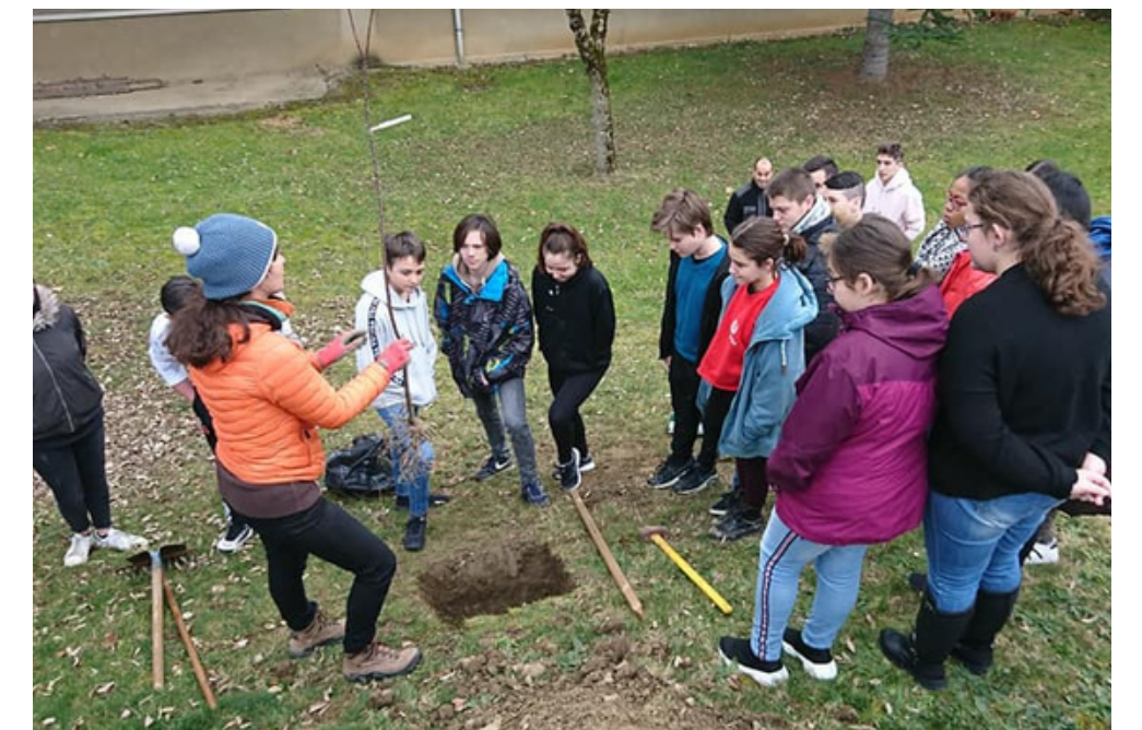
Ecole Primaire de LABECEDE-LAURAGAIS (11400) Verger - 12 arbres & 15 arbustes fruitiers - 2022

Cliquez sur les photos pour découvrir les articles de Presse !