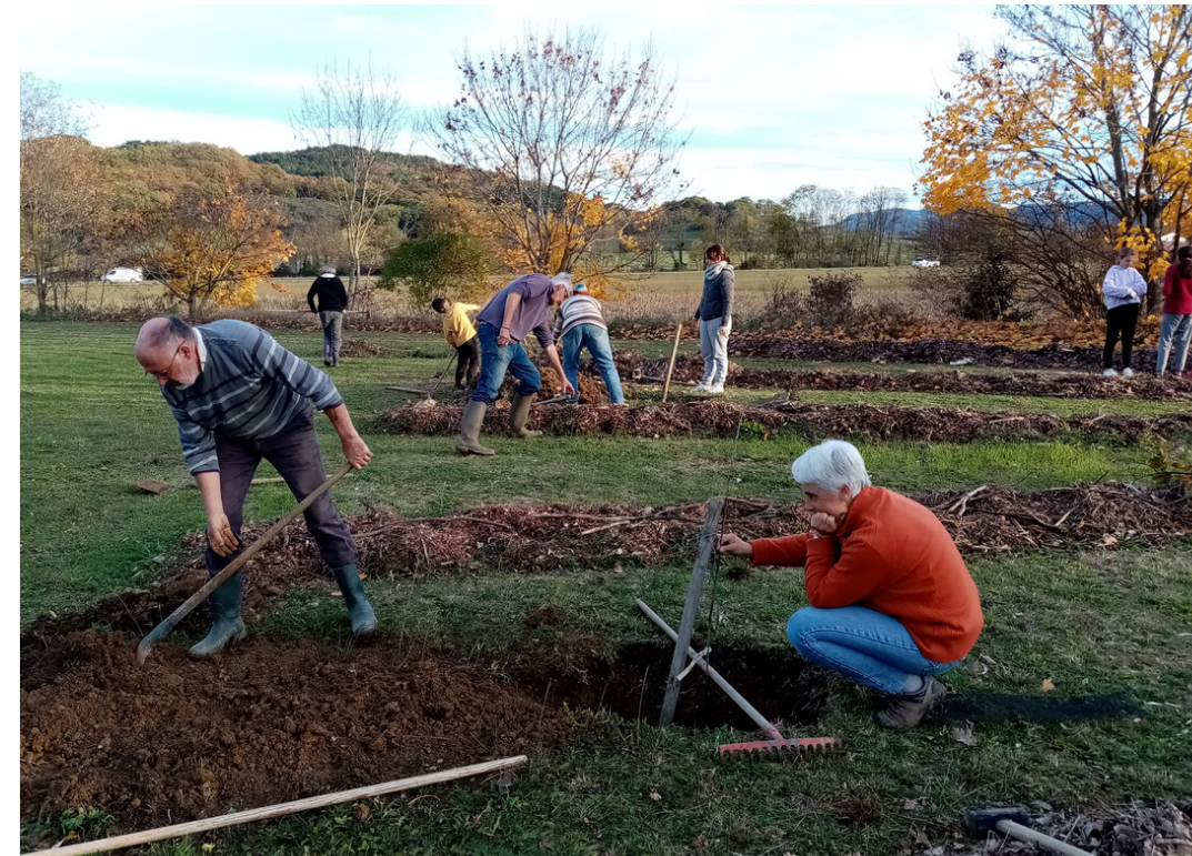
AIGUES-VIVES (09600) Verger du jardin pédagogique de l'association "AVEC" 10 fruitiers - 2022