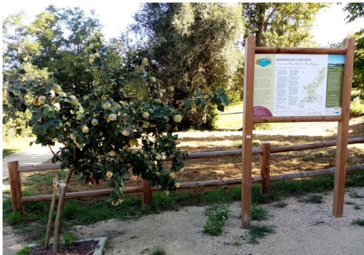
Cognassier Aromatnaya Trézières