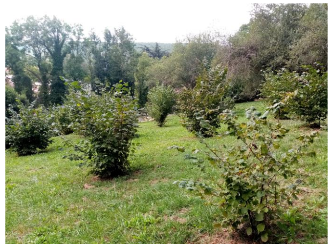
Collection de noisetiers Lavelanet