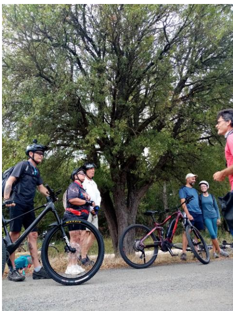
Sortie botanique ENSEMBLE à vélo avec Ecodiv depuis Belvèze- du-Razès