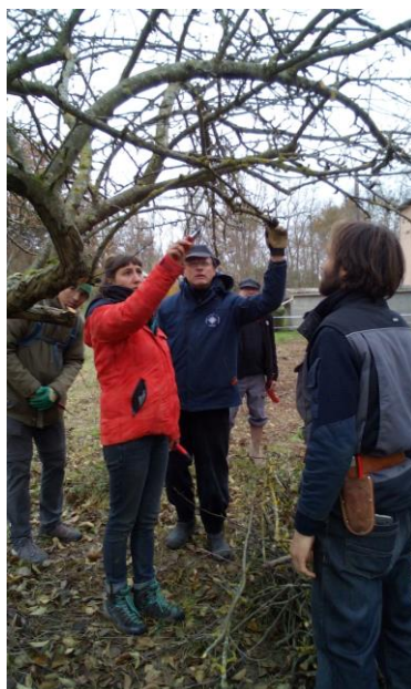
Stage de taille douce des fruitiers