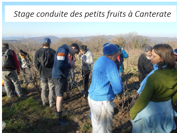
Stage conduite des petits fruits à Canterate