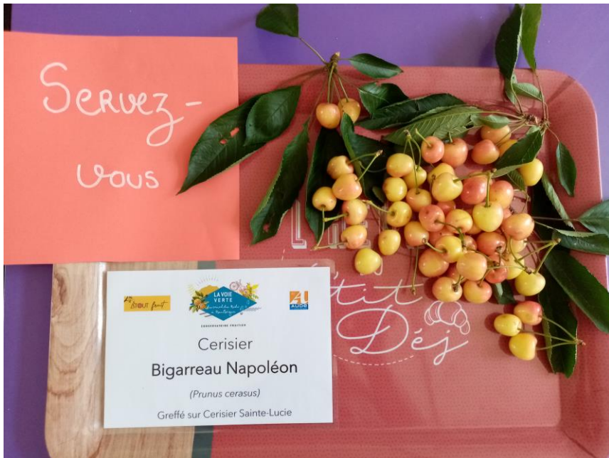
Cerises Bigarreau Napoléon Chalabre