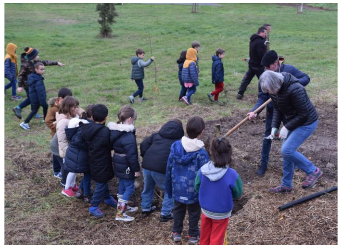
VERNIOLLE - 10 fruitiers, plantation avec l'école