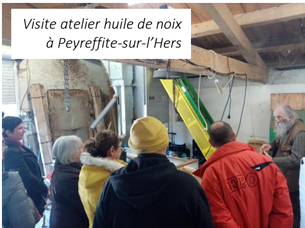
Visite atelier huile de noix à Peyreffite-sur-l'Hers