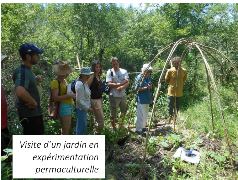
Visite d'un jardin en expérimentation permaculturelle