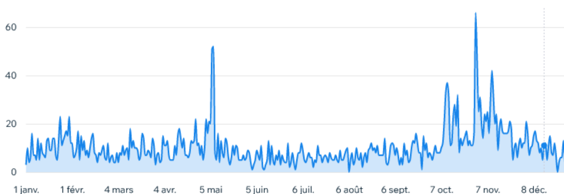
Nombre de visites par jour