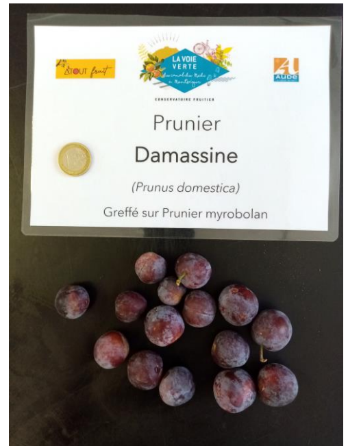
Prunes Damassine Chalabre