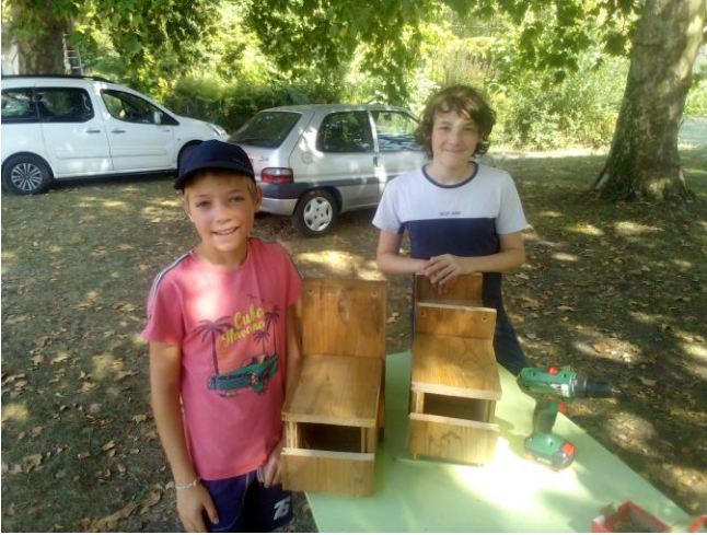
Fabrication de nichoirs à Chalabre