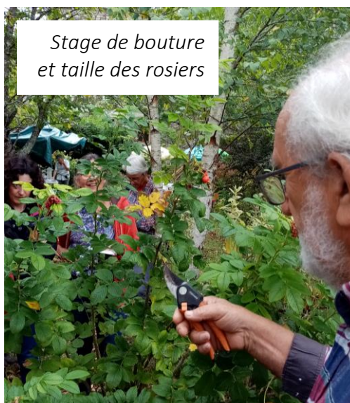
Stage de bouture et taille des rosiers