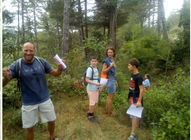
Rallye Nature à La Bezole Programme ENsemble