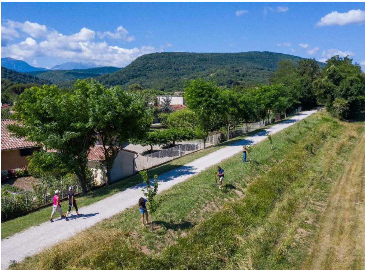
Entretien des fruitiers du conservatoire ouvert le long de la Voie Verte à la Bastide-sur-l'Hers, en Ariège

Ainsi depuis 2017, l'association Atout Fruit crée le conservatoire ouvert d'espèces fruitières anciennes le long de cette Voie Verte en valorisant l'existant, greffant et replantant de jeunes arbres, sur le linéaire et en vergers collections, alternant espèces et variétés au gré des sols et des climats. Mais quelle meilleure conservation que la diffusion ? En plantant chez vous ces variétés sélectionnées par nos soins pour la qualité de leurs fruits (gustative, tenue), vous contribuerez à la sauvegarde du patrimoine fruitier et de la biodiversité. En choisissant de vous fournir chez Atout Fruit vous soutenez le développement du conservatoire fruitier ouvert de la Voie Verte !