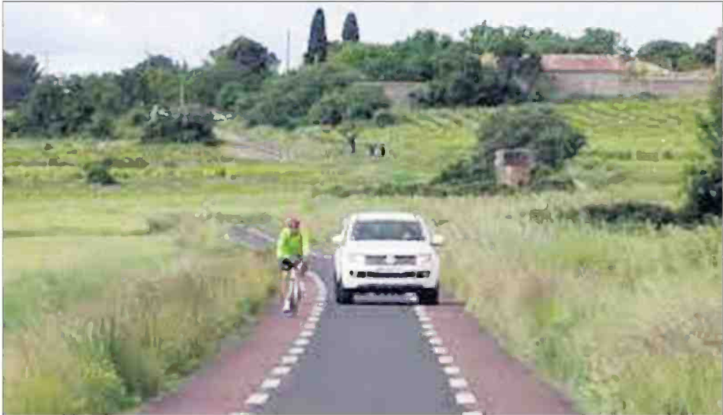
À terme, la chaussée à voie centrale banalisée ira du canal du Midi au château de Montségur.

l'essentiel La reconversion en « voie verte » de la ligne ferroviaire Bram-Lavelanet, dont l'exploitation a pris fin en 1973, sera une réalité dès juin 2022. Marcheurs, cyclistes, et adeptes de la course à pied pourront arpenter les 65 km de l'itinéraire (42 km dans l'Aude et 23 km dans l'Ariège). Au total, près de 7 millions d'euros auront été investis dans cette réalisation d'envergure qui est le fruit d'un travail partenarial entre les départements de l'Aude et de l'Ariège, trois communes audoises, avec le soutien de l'Europe, de l'État, et de la Région Occitanie.