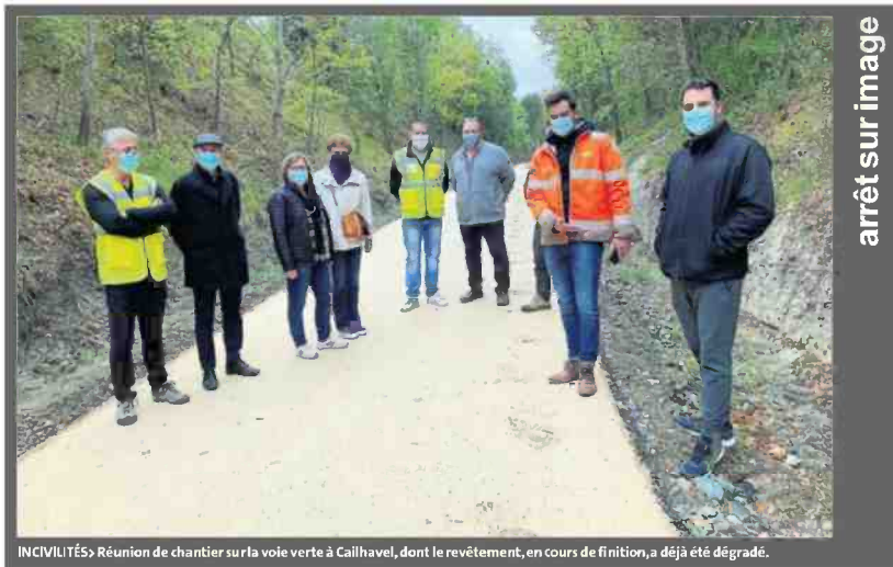
INCIVILITÉS Réunion de chantier sur la voie verte à Cailhavel, dont le revêtement, en cours de finition, a déjà été dégradé.

65 % du montant est pris en charge par l'Europe, l'État et la Région, 23 % par le département de l'Aude et le reste par les trois intercommunalités traversées par la voie : la communauté de communes des Pyrénées Audoises, celle du Limouxin et de Piège Lauragais Malepère.