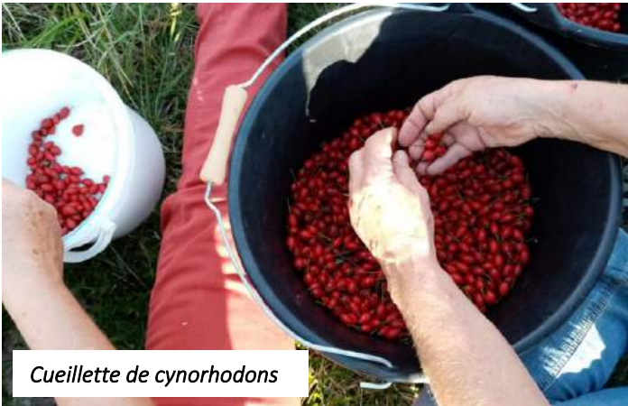
Cueillette de cynorhodons