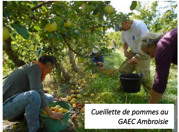
Cueillette de pommes au GAEC Ambroisie