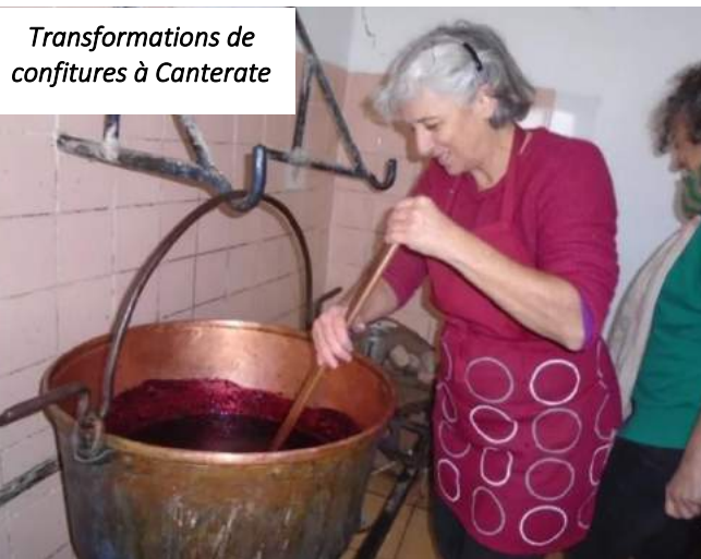
Transformations de confitures à Canterate