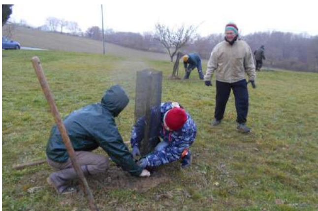
Plantations et taille à Roumengoux