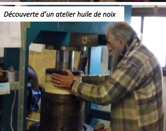
Découverte d'un atelier huile de noix