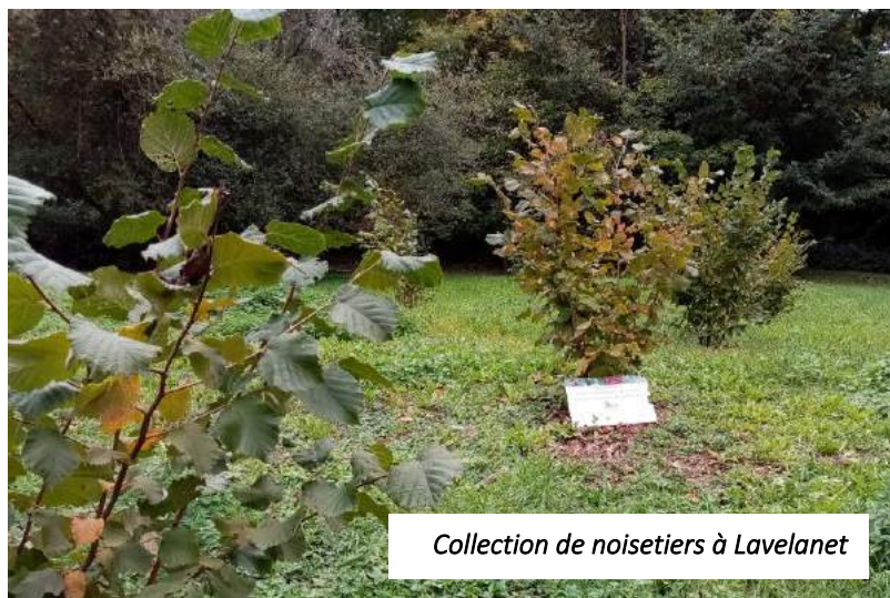
Collection de noisetiers à Lavelanet