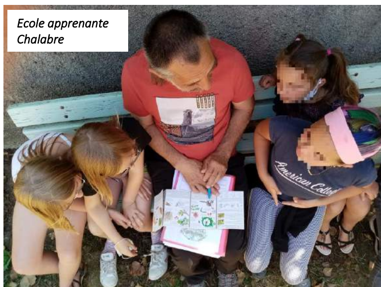
Ecole apprenante Chalabre