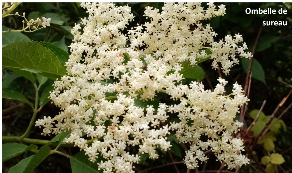
Ombelle de sureau

Dimanche 21 mai – 9h à 13h – Montbel, Ariège